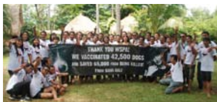
Het BAWA-team viert het aantal honden dat al ingeënt is

Eén van mijn fijnste redden was die van Mia, een blinde pup. Ik vond haar een paar maanden geleden, 's morgens vroeg op een overstromde, van ratten vergeven markt. Het is een wonder dat ze de eerste zeven weken van haar leven door is gekomen. We zorgen nu voor haar in het BAWA-kantoor in Ubud. Ik huurde mensen in, zodat er 24 uur per dag op haar werd gepast. Het is een ongelooflijk aanhankelijke, lieve en gevoelige hond".