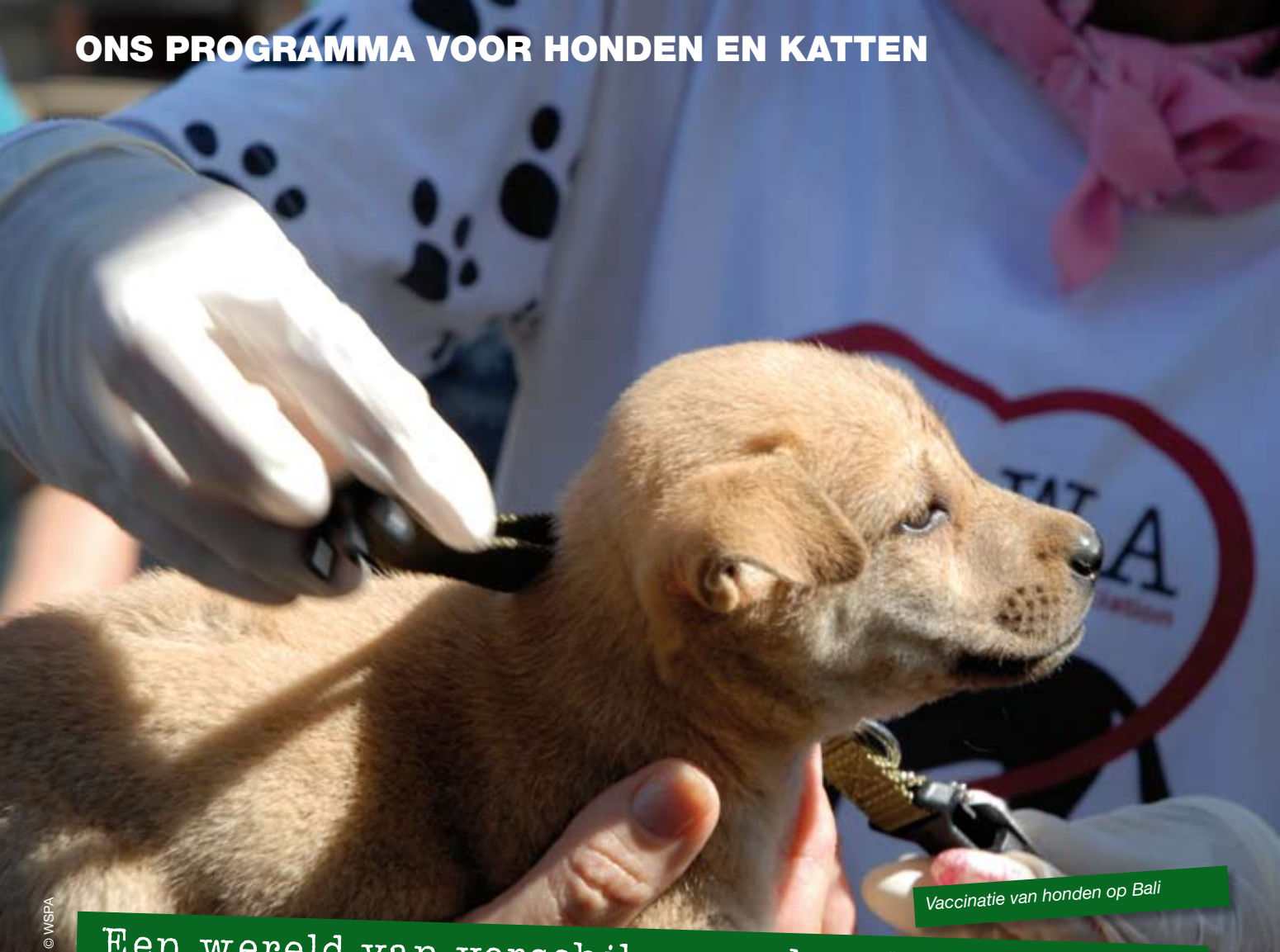
Vaccinatie van honden op Bali

Een wereld van verschil...voor honden en katten